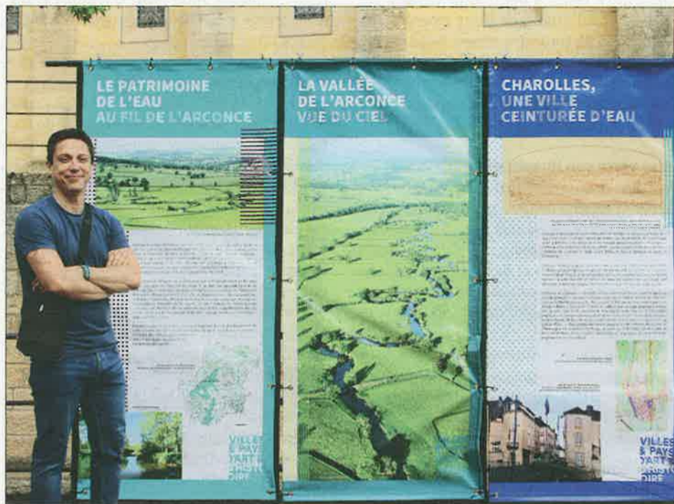
Installée le long du canal de l'église à la médiathèque, l'exposition permet d'en apprendre plus sur l'Arconce entre Anzy-le-Duc et Charolles. Un livret est disponible dans les offices de tourisme

■ L'exposition est visible jusqu'aux Journées du patrimoine qui auront lieu samedi 18 et dimanche 19 septembre.