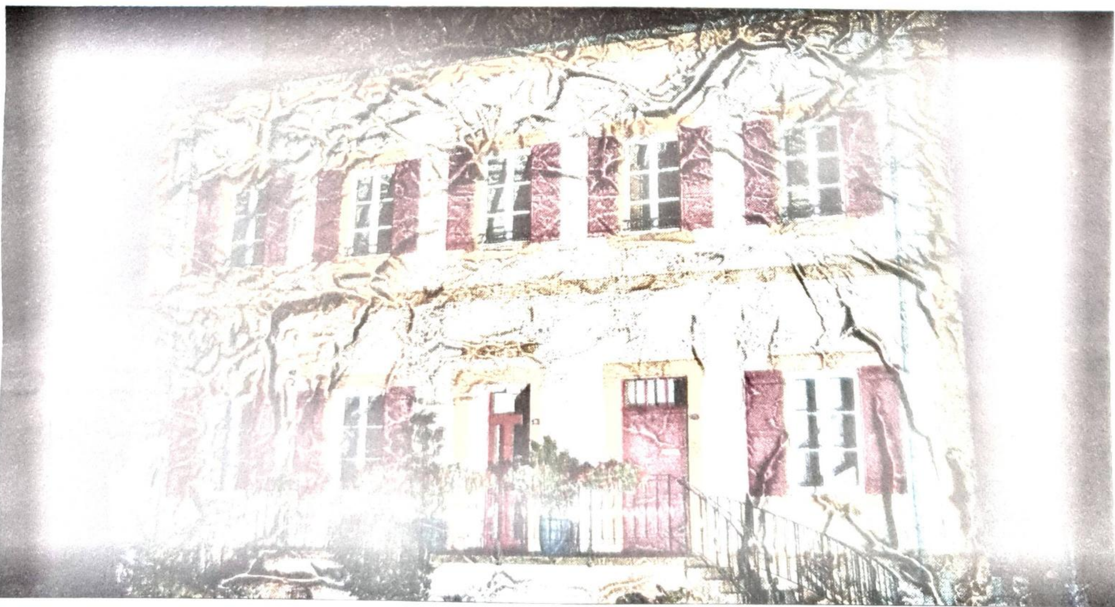
Le départ des visites, libre ou guidée, se fera depuis le bâtiment de la mairie

■ Visite guidée à 21h et à 22h les deux soirs. Départ des visites devant la mairie.