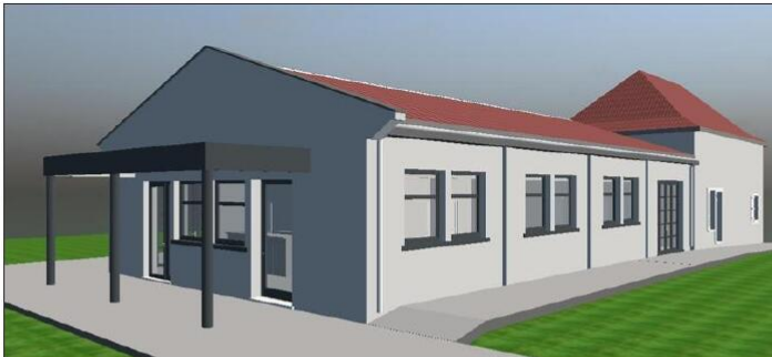
Le projet phare du mandat présenté aux habitants. Illustration du cabinet d'étude et maîtrise d'œuvre Côté plan

Dimanche 4 septembre, le maire Jean-Louis Petit entouré de l'équipe municipale a reçu les habitants dans l'ancien atelier de menuiserie située au bourg. C'est dans cette structure qu'un commerce de proximité va voir le jour.