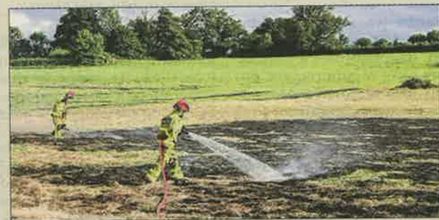
Une douzaine de pompiers sont intervenus.

Ce lundi après-midi, un peu avant 17 heures, les pompiers ont été appelés sur un feu de culture le long de la D25. Alertés par d'épaisses fumées blanches visibles depuis la RCEA, des riverains ont prévenu les secours. Mais il s'agissait en fait d'un feu sous contrôle allumé par un agriculteur afin d'assainir et fertiliser son sol. La pratique étant interdite par arrêté préfectoral, une douzaine de sapeurs-pompiers de Paray-le-Monial, Gélénard et Montceau-les-Mines ont procédé à son extinction sur une surface d'environ quatre hectares. Une intervention rendue difficile par un terrain particulièrement humide. « Il faut absolument éviter ce genre de pratique », insistait le lieutenant Romain Comte.