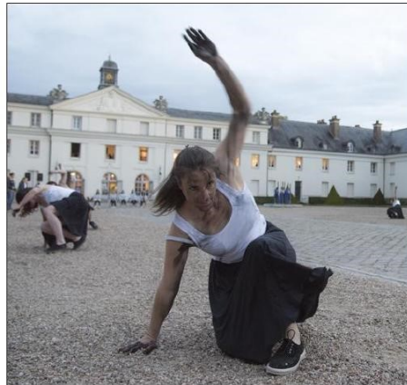
La Verrerie, un bel espace habité par la danse de l'école Marine Ray et sublimé par les entrelacs de couleurs, matières et textures de Julien Guiller.

« Cette soirée est l'union du lieu, des objets tels le Pilon, la Cristallerie et des ouvriers et